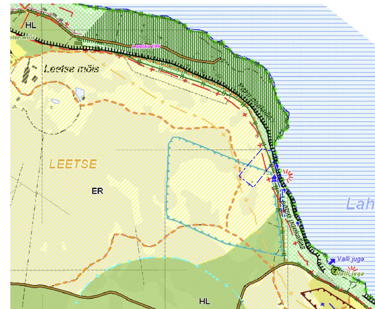
Eesti Vabariigi topograafiline kaart aastast 1931